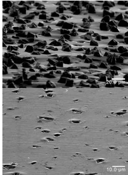
Abb. 2: Kontaktfläche einer reibschlüssigen Verbindung mit EKagrip® reibungserhöhender Folie nach Montage und Demontage