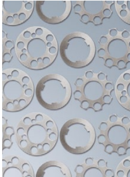
EKagrip® reibungserhöhende Folien nach Kundenspezifikation – fünfzigmillionenfach bewährt

Mit den EKagrip® reibungserhöhenden Folien eröffnen sich vielfältige Möglichkeiten, leichtere und kompakte Konstruktionen zu realisieren, ohne dabei Kompromisse in Puncto Kraft- und Drehmomentübertragung eingehen zu müssen.