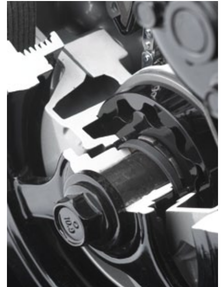
EKagrip® reibungserhöhende Folie in GM L5 Kurbelwellenanwendung